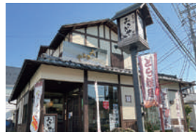
お気に入りのお菓子を見つけに、出掛けてみませんか