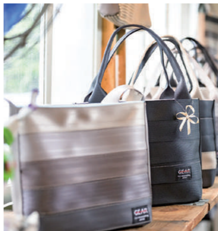
工場内に併設した店舗「エコリメ」には予約してご来店を

「かつて人の命を守ってきた耐久性に優れた素材です。新たな価値を付加して、長く愛用できるものにしたかった」と話す上村社長。今後は、子どもたちや親子を対象に廃材を利用したワークショップの開催にも力を注ぎ、環境への負荷を減らす活動も展開していきます。