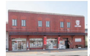
高品質と安全性が認められ、農林水産大臣賞、群馬県知事賞などを受賞

自社ブランドの豚肉「下仁田ポーク」の生産、加工、販売を展開。養豚事業部では豊かな自然の中、徹底した衛生管理のもとで、栄養たっぷりの良質な肥料で健康な肉豚を育てています。ミート事業部は、生産された肉の加工と販売を担当。新鮮な状態で届けたいと、スピーディーに衛生的に処理し、毎日直売しています。内臓、豚骨、豚足、ピートロなど全ての部位を扱うのは生産者ならではの強み。こだわりの料理店から家庭用、BBQ用まで幅広く利用されています。店内では厳選した鶏肉や牛肉も販売。惣菜コーナーもあり、「下仁田ポーク」で作った肉汁たっぷりのメンチカツ(100円)は、かなりのお得感!