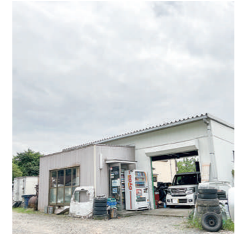
吉井に根ざして22年。地域密着、丁寧、親切がモットー