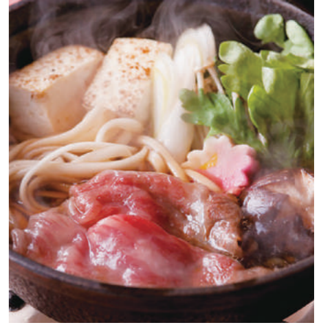
鮮やかな赤身の上州牛がたっぷり。豪華な「すき焼き御膳」