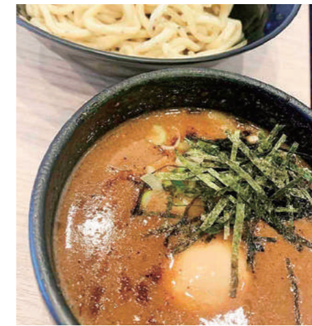
味玉つけ麺1,100円。名物チャーシューは全品にトッピング

10~5月までは「煮干しラーメン」(930円)が登場。煮干し、貝柱、鶏、魚介のあさり系スープで、こちらも超人気です。