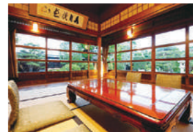
全ての個室から日本庭園を鑑賞できます。散策もOK

昭和13年に建てられた総檜造の日本料理店。和風建築の中に漂う洗練された美しさが認められ、2008年に国の登録有形文化財に指定されました。窓は厚めの昭和レトロガラス。手入れの行き届いた庭園を窓越しに眺めると、少し歪んで見える独特の景色が広がります。ぜひ実物をご覧あれ。様々なこんにやく料理が並ぶ「こんにやく会席」、月替わりの「四季会席料理」、肉の旨みが決め手の「上州牛のすき焼き御膳」など、厳選した地元の食材を心を込めて調理した品々は、相席無しで個室で召し上がれます。