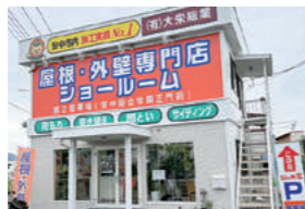
予約制のショールーム。1階と2階を約1時間でご案内

安中を拠点とするリフォーム会社。緊急時にもスピーディーに対応できるように、同社から30分以内のエリア限定でリフォームを行います。今年3月には屋根、外壁、雨どい専門のショールームをオープン。種類が豊富な屋根材、外壁材の模型を置くことで、比較検討が可能になりました。また、雨漏りや老朽化で劣化した屋根や外壁の実物も展示。住まいの寿命を縮める原因を丁寧に説明します。おすすめの対処法は、独自に開発した工法で、屋根や外壁をはがさない「重ね葺き工法」。低コストのうえ工期も短いため、評判は上々です。リフォームを計画されている方は、同社ショールームを訪ねてみませんか。