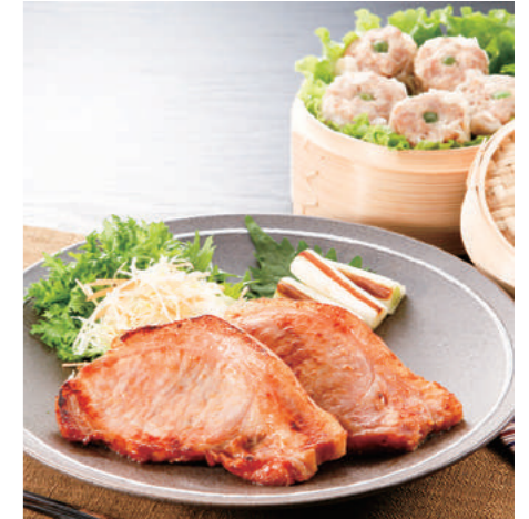
豚ロース肉のもろみ味噌漬けと自家製肉シウマイのセット3,300円