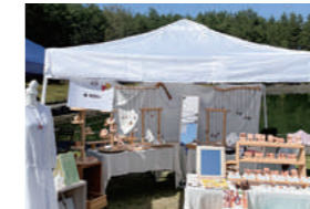
イベント出店でお客様と触れ合うと新たな作品のヒントが得られます