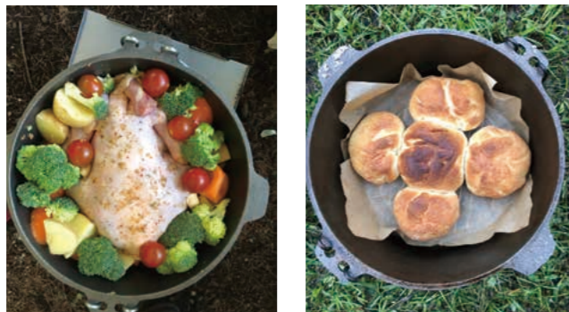
50代女性からの投稿です。コロナ禍もなんのその、仲睦まじいご夫婦の様子が実にうらやましい！

任せ、自然を感じながらゆったりと贅沢な時間を過ごしています。食材は途中の道の駅などで、旬の新鮮な野菜などを調達します。焼く・炒める・煮る・蒸す・揚げる・燻すなど、1台で幅広い調理に対応するダッチオーブンを購入してからは、夫の料理のレパートリーが格段に広がっています。ローストチキンに、チーズやレーズン、あんこ、ナッツなどが入ったパン、いろいろな食材のスムークもします。挽きたてのコーヒーマドに入れてもらって、至福の時を過ごしています。