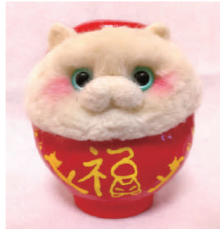
「福々にゃんだるま」(1,000円〜)は両手に収まるサイズからあります

また、カラフルな「ニャマビエ様」、猫好きにはたまらない表情を描いた絵はがきセット、マスクに付けるマスクチャームなども制作。雑貨は県内6ヶ所と県外2ヶ所のお店で委託販売をしています。可愛い雑貨と、ほっこりした時間を過ごしませんか。