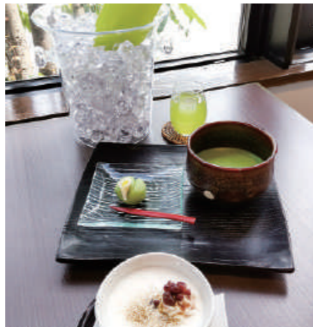
手前から、ほうじ茶プリン(420円)、和菓子付きの抹茶八重(530円)、お水代わりの冷茶