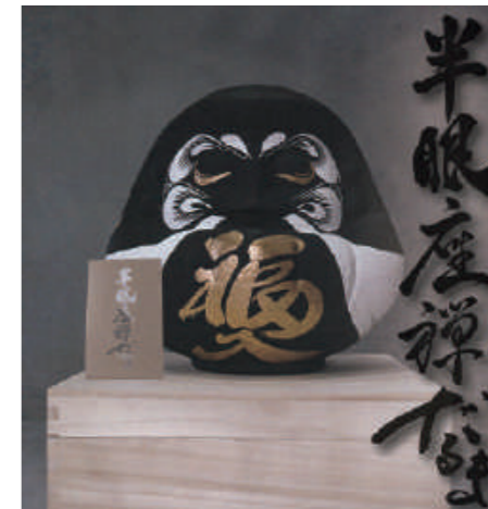
半眼座禅だるまは高さ36cm、幅約32cm、奥行約32cm、プレート、桐箱付