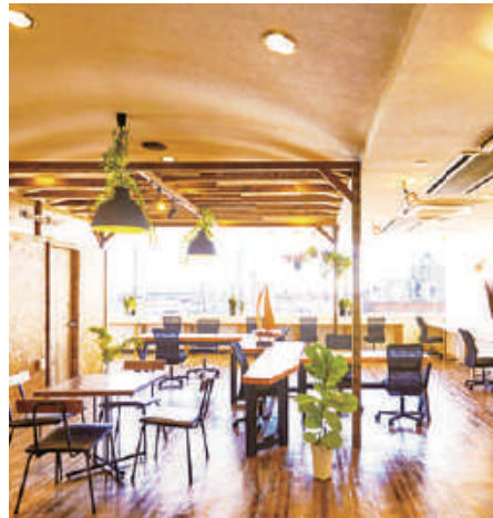
今年4月にオープンした「セブンシーズ」。絶景のパノラマが広がります

また、昨年1月からホテル1-2-3前橋マーキュリーに、新たなコワーキングスペース「マーキュリー倶楽部」も展開。ゆったりとしたデスクで快適に仕事や勉強に集中できる「セブンワークス」と、リースペースやウェブミーティング向けの半個室ブース等を備えた「セブンシーズ」があります。テレワークユーザーも大歓迎。フリードリンク(お茶や本格珈琲)あり。