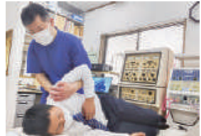
強い力を加えない施術なので、リラクゼーションできます