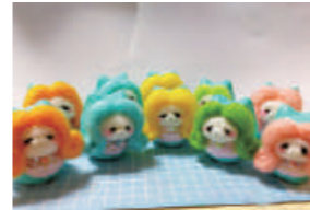
カラフルヘア〜と目がチャームポイントの「ニャマビエ様」は1,000円〜