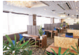
個別デスクが並ぶ「セブンワークス」。クラシックやジャズが流れます