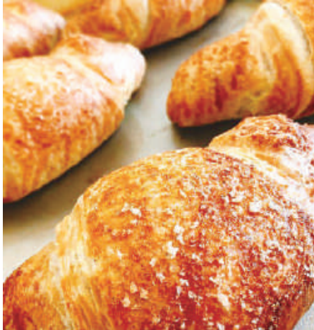
オーブントースターで1~2分温めると、香ばしさがアップ