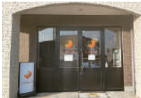
高崎問屋町駅の貝沢口近く。オレンジ色の三日月が目印

濃厚なヨーロッパ産のバターをたっぷり使って、丁寧に焼き上げるクロワッサンの専門店。常に焼き立てを提供したいと、手間を惜しまず何度も焼いています。サクサクの生地を頬張ると、芳醇なバターの風味が広がるリッチな味わい。プレーンタイプはノーマルの「くろわっさん」(183円)、塩気のあるバターで作る「ギッフェリ」(216円)、極上の発酵バターを使用した「くれせと」(270円)の3種類です。プレーンのクロワッサンでサンドイッチを作ると、豪華な雰囲気に仕上がります。