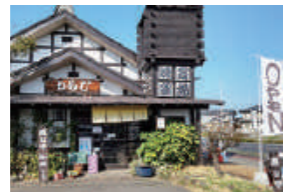
饅頭をふかす湯気を見ると、食べたくなる方も多いのでは？