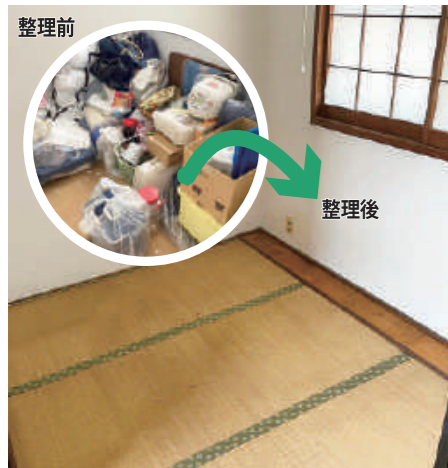
部屋の片付けや遺品整理は得意分野。廃棄物も処理します