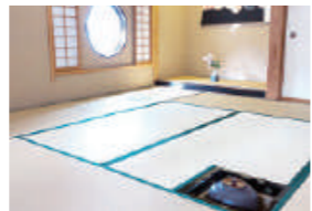
しょうじゅあん 茶室「松樹庵」。お茶会やお稽古などに利用できます

国内各地の厳選したお茶を販売。緑茶、抹茶、自家焙煎茶、和紅茶など豊富な種類が揃います。嬉しいことに試飲もOK。「お茶を身近に感じてほしい」と、美しい中庭を眺められる茶室のほか、カフェも併設し、その魅力を発信しています。毎月16日は茶室で「十六夜の茶会」を開催。希望者には、まろやかな味わいの抹茶を振る舞います。作法を知らなくても問題なし。誰でも気軽に参加できるので、お出掛けしてみても？ カフェでは、お茶を使った季節感あふれる甘味や、食事が楽しめます。こだわりの食材を集めた「おにぎりセット」(670円)は限定15食。競争率が高いので、予約がおすすめです。