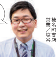
榎名町支店 営業/塩谷

※十六夜の茶会は新型コロナウイルス感染症の状況により不定期開催となる場合あり。ご参加の際はお問合せを