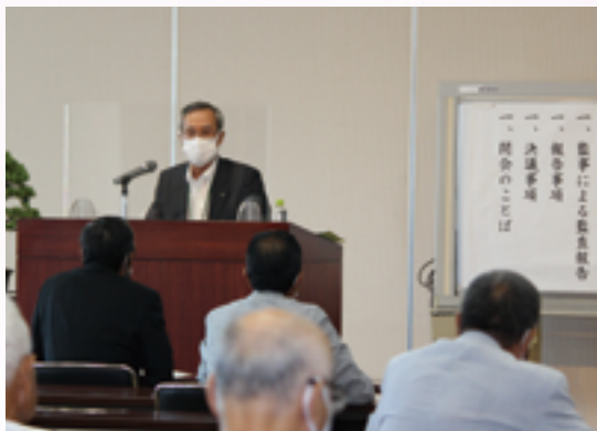
通常総代会の様子