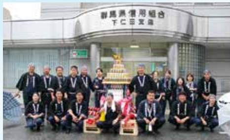
下仁田こんにゃく夏まつり