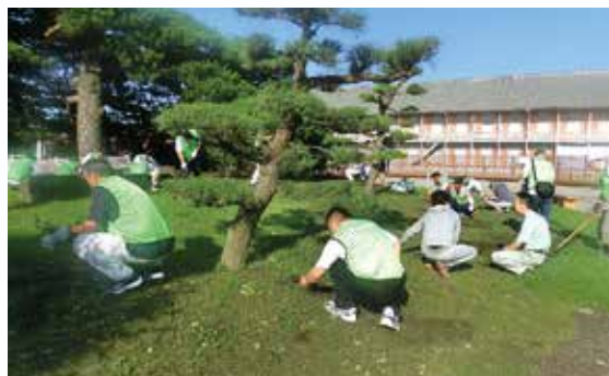
リレー・フォー・クリーン

令和1年度は延べ98名の職員が参加し、場内の除草等のお手伝いをさせていただきました。