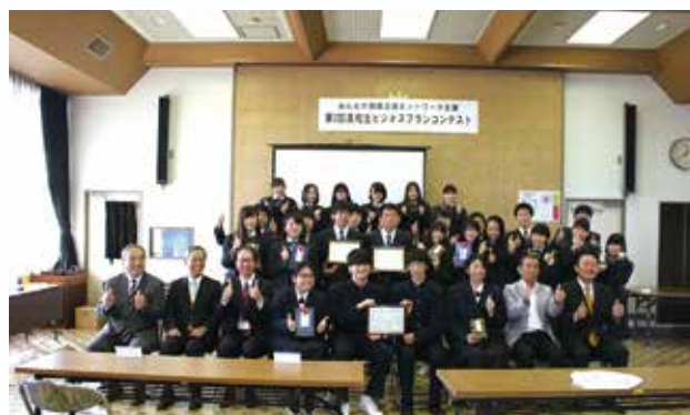
高校生ビジネスプランコンテスト

厳正な審査の結果、松井田高校Eグループのプラン「高校生発エコバッグ」が高く評価され、見事優勝に輝きました。