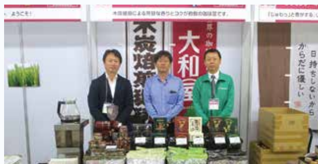
食のビジネスマッチング