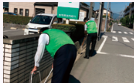
店舗周辺の清掃活動

毎月第2水曜日の朝、全店舗の役職員が店舗周辺の清掃を行い、地域の環境美化のお手伝いをさせていただきます。