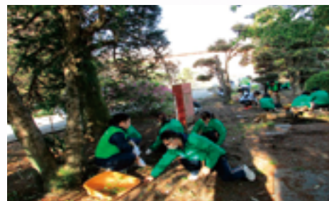
富岡製糸場内の除草作業

令和2年度は3回開催され、延べ66名の職員が参加して除草作業などのお手伝いをさせていただきました。