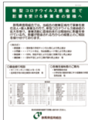
新型コロナウイルス感染症相談お知らせチラシ