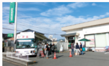
高崎支店における献血活動

令和2年度は新たな取り組みとして、高崎市内の商店街に協賛し、11月に当組合高崎支店を会場とした献血活動を行いました。