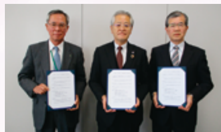
3信組による覚書締結式

群馬県内にて営業を行っている当組合、あかぎ信用組合、ぐんまみらい信用組合の3信組において、それぞれの経営理念に基づき、信用組合の原点である「相互扶助」を使命とし、「協調」の名の下、お互いを補完し合うことで群馬県全域の活性化および発展に貢献する目的で、『群馬県内3信組における協調融資に関する覚書』を締結いたしました。