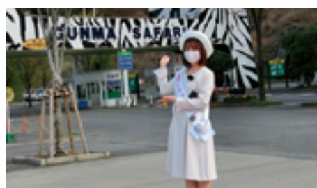
富岡市シルクレディの活動

令和 2 年度は、安中市の観光キャンペーンレディおよび富岡市のシルクレディを務めさせていただきました。