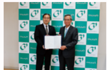
保証協会との覚書締結式

当組合と群馬県信用保証協会は、地方創生および地域産業の競争力強化を目的とし、群馬県内の中小企業・小規模事業者への支援を両機関が連携・協力して実施し、地域経済の活性化および発展の促進を図るため、『中小企業・小規模事業者の振興に係る相互協力に関する覚書』を締結いたしました。