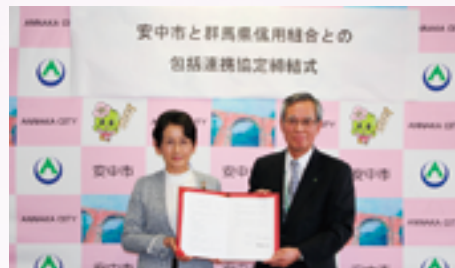
安中市との包括連携協定締結式

当協定の締結により、安中市内における起業・創業や経営支援、移住・定住の促進、福祉・医療の充実といったさまざまな地域の課題について、当組合および安中市が有するネットワークや情報を活用して解決を図ってまいります。