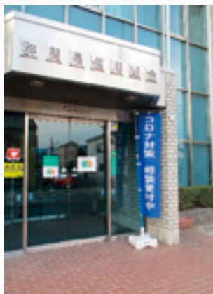
新型コロナウイルス感染症相談窓口設置の様子

さらに、平日の相談業務に加えて、5月9日(土)から7月25日(土)までの毎週土曜日にも安中支店、高崎支店、富岡支店内に相談窓口を設け、営業推進部内には電話相談窓口を設けて、お客さまからのご相談に真摯に対応いたしました。